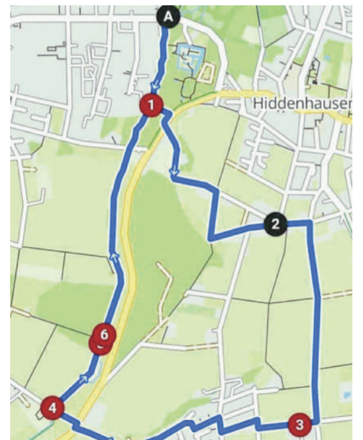
Die 7,3 Kilometer lange Brandbach-Runde ist einer der schönsten Hiddenhausener Rundwanderwege.

Sehenswürdigkeiten informieren möchte, findet unter www.komoot.de unter dem Stichwort „Brandbach-Runden“ alle wichtigen Informationen.