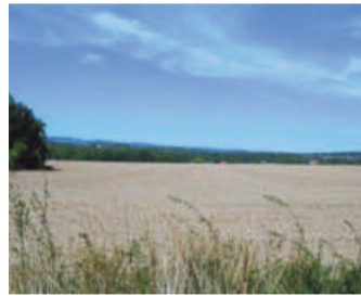
Im Norden sind die Hügel des Wiehengebirges gut zu erkennen.

HIDDENHAUSEN (HK). Eine der schönsten Hiddenhausener Rundwanderwege überhaupt ist die 7,3 Kilometer lange Brandbach-Runde. Viele schattige Plätzchen, zahlreiche Möglichkeiten für kleine Verschnaufpausen, kaum Autos und traumhaft schöne Ausblicke auf die Kreise Herford und Minden-Lübbecke machen diese Route zu einer der Lieblings-Teststrecken von HK-Mitarbeiterin Sonja Töbing. Die gut zwei Stunden Fußweg vergangen wie im Flug – auch dank der hervorragenden Vorbereitung durch die Wandergruppe des Heimatvereins Eilshausen, die alles ausgearbeitet hat. Mit dem Auto geht es zum Wanderparkplatz gegenüber von Gut Bustedt. Das Biologiezentrum mit seinem weitläufigen Areal ist an sich schon einen Abstecher wert. Der Brandbach plätschert trotz langanhaltender Trockenheit noch immer sanft vor sich hin, Hühner, Ziegen, Gänse und Enten kreuzen den Weg der Wanderer. Das Anfang des 15. Jahrhunderts erbaute Anwesen