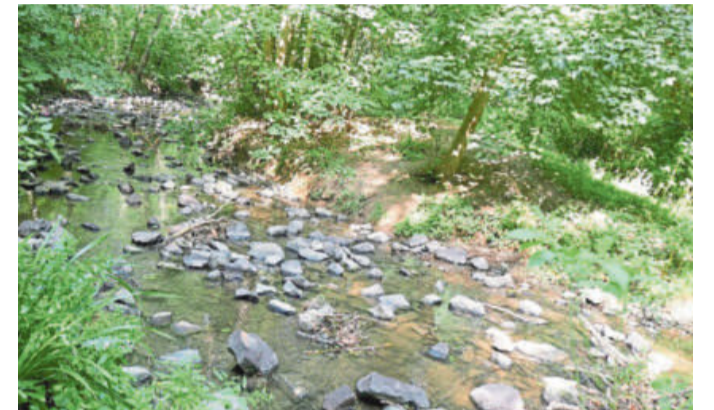
Trotz der langanhaltenden Trockenheit fließt im September dauerhaft Wasser im Brandbach.

Sehenswürdigkeiten informieren möchte, findet unter www.komoot.de unter dem Stichwort „Brandbach-Runden“ alle wichtigen Informationen.